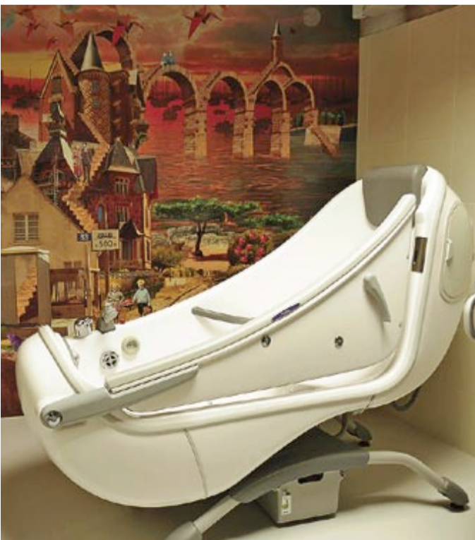
SALA DE hidromasaje.