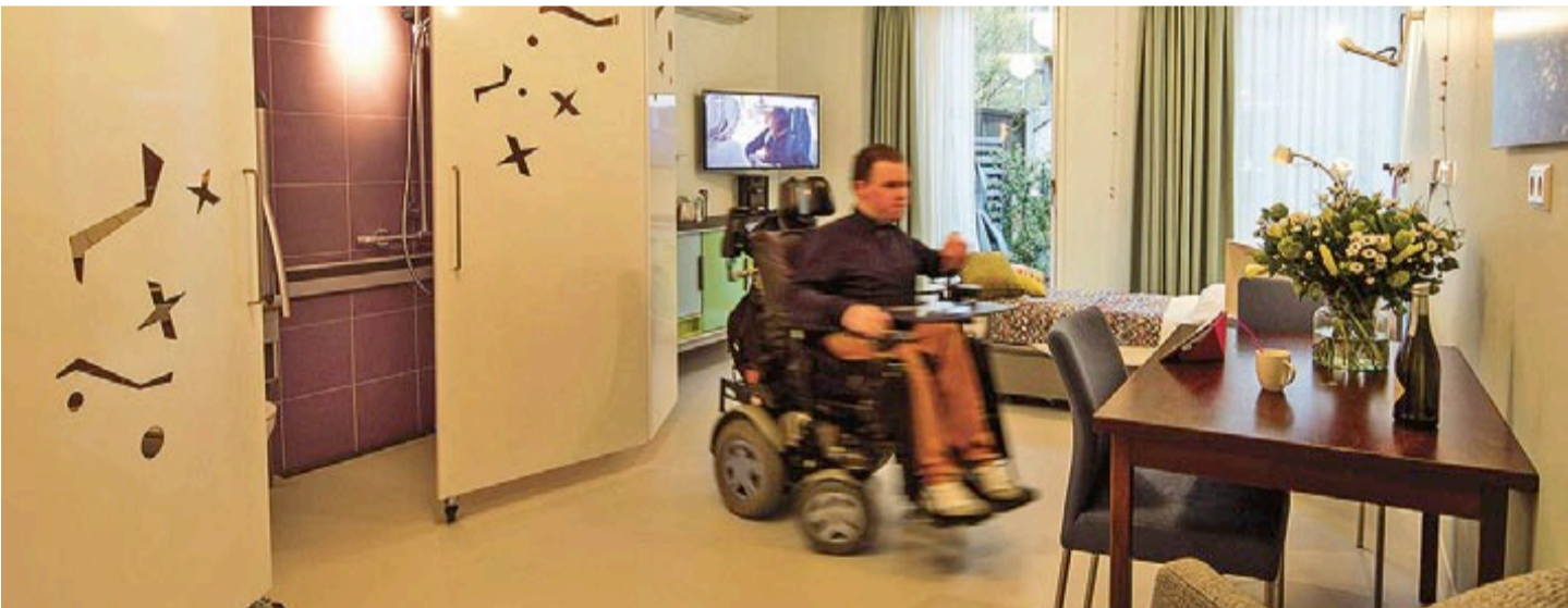
UNA HABITACIÓN en Xenia.